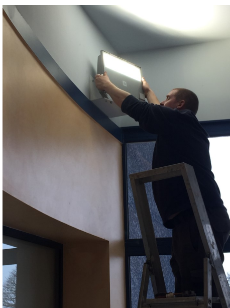
Pose d'éclairage Led dans le hall du groupe scolaire

En attendant l'été, les commissions voirie et bâtiments vont continuer leur travail au service de nos concitoyens, sur des projets de moindre envergure moins spectaculaires mais néanmoins indispensables à la vie de la commune.