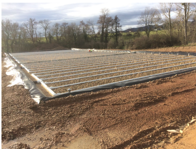
Nouvelle station de traitement des eaux usées.

Votre municipalité soutient le service de proximité.