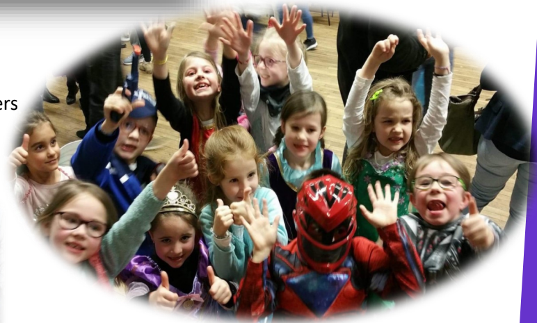
Carnaval du sou des écoliers