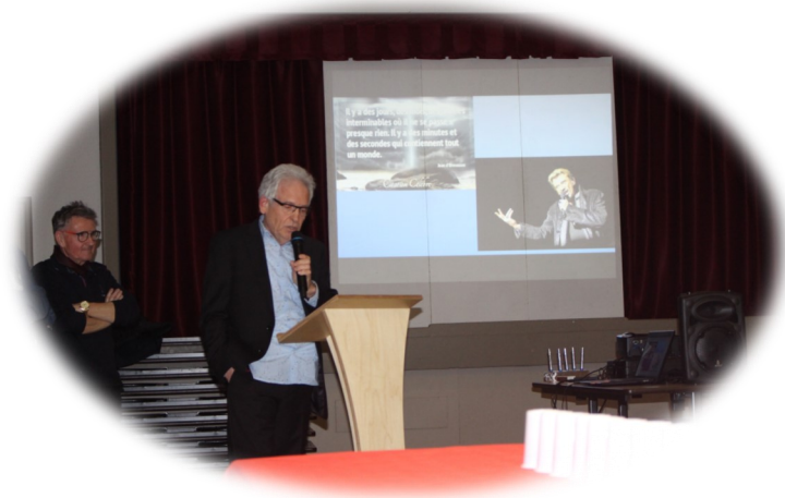
Vœux de la municipalité