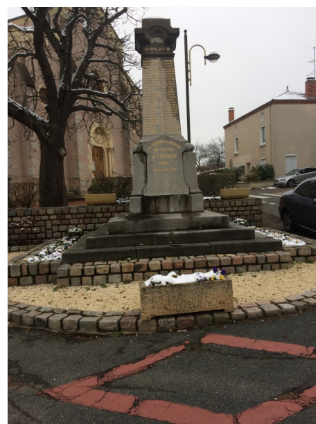
Le monument aux morts va être déplacé