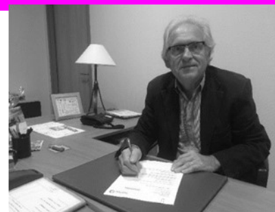
Bernard SAINRAT Maire de Lentigny

Nos investissements de cette année seront l'aménagement du centre bourg avec l'accès de notre église pour les personnes à mobilité réduite le déplacement de notre monument aux morts. L'aménagement autour du pôle sportif à savoir la déconstruction d'un ancien local associatif afin de libérer de l'espace pour du parking et la création d'une aire de jeux pour enfants place du cèdre.