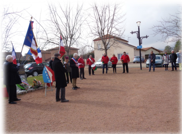
Cérémonie du 19 Mars