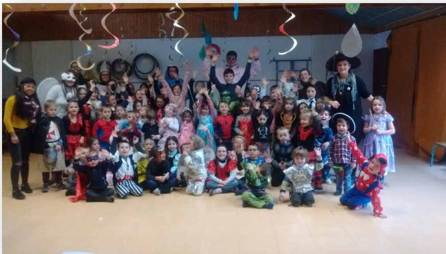
Carnaval du centre de loisir