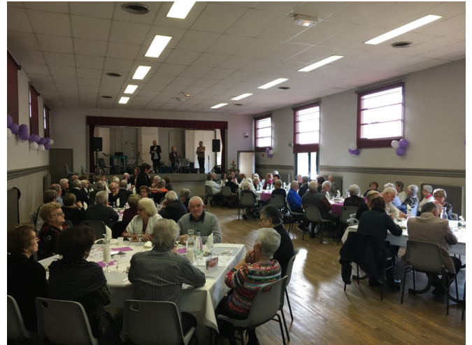
Repas de l'amitié