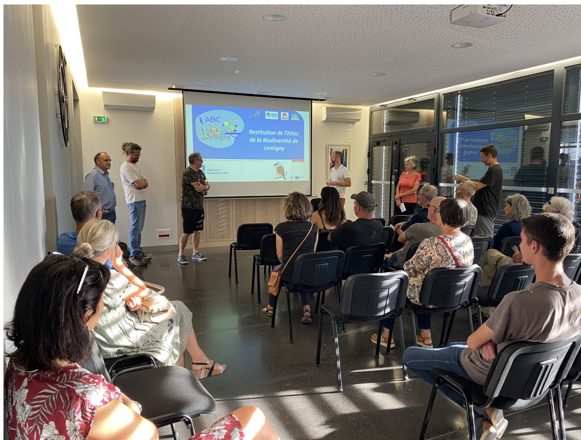
Réunion publique de restitution