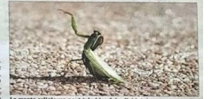
La mante religieuse peut très bien faire l'objet de ce concours photo car elle est très présente sur le territoire.

Lors des vacances, les habitants peuvent immortaliser la faune locale et participer au concours photo organisé en partenariat avec la Ligue de protection des oiseaux (LPO).